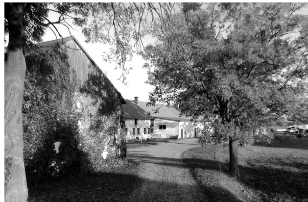
Vesnická idylka na statku u Peštů

vou, zde nalezneme také koně, kozy, holuby, slepice, králíky a včelí úly. Před odchodem se Vladimír Pešta ptám, zda je dle jeho názoru v dnešní době těžké podnikat v oboru zemědělství. „Snadné to není. Jsme závislí na počasí, které neovlivníme. Zemědělství je závislé na dotacích, které podléhají politickému rozhodování. Administrativní zátěž je obrovská. Pořád nás někdo kontroluje. Tvorba cen a konkurence je globální, sami si výkupní ceny neurčíme. Podnikáme