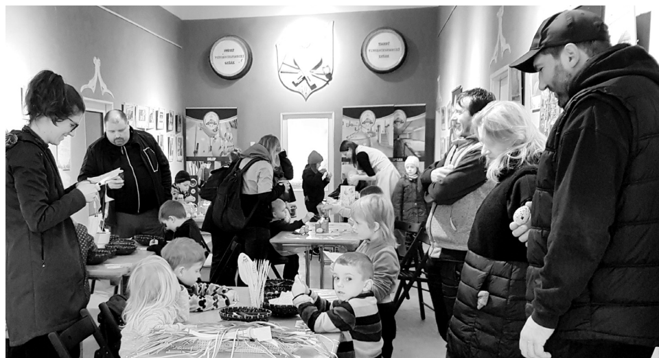
Při předvelikonoční akci na Vysokém Chlumci bylo možné si vyzkoušet také zdobení vajíček. Více na str. 13