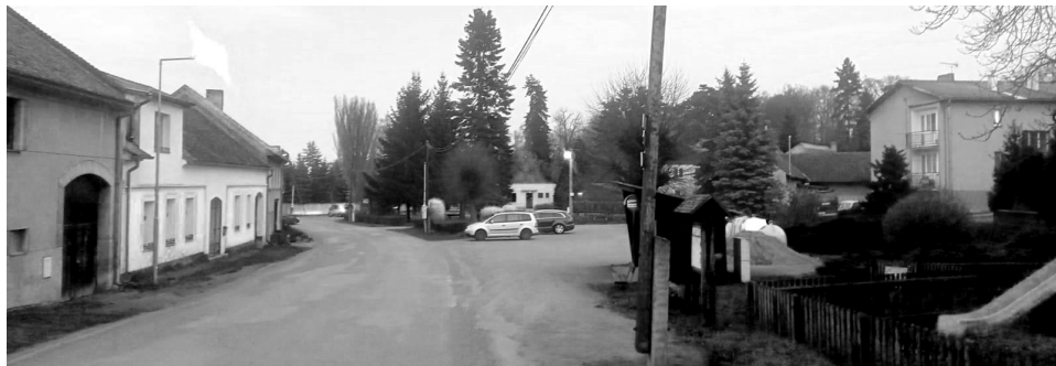
Místa pro instalaci měřičů rychlosti aut v Třebnicích jsou na sloupech z obou stran.

ant byl odborem investic městského úřadu doporučen základní ukazatel bez statistik, včetně přídatného panelu ‚zpomalte‘. Za cenu