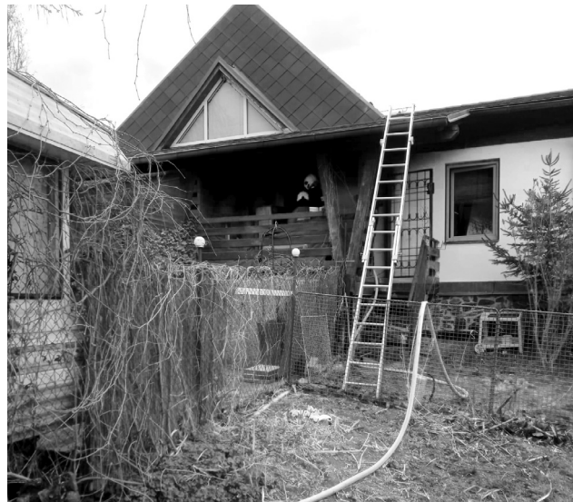
Hasiči museli zlikvidovat ohnisko požáru pod střechou.

nice Sedlčany, velitele čtyř z centrální hasičské stanice