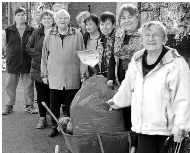
Skupina žen z Libíně na jarní brigádě