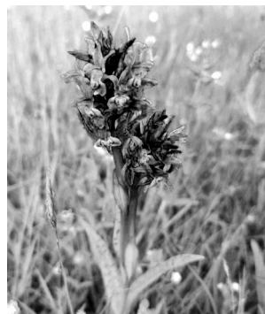
Vstavač kukačka.

Dokončení ze strany 1 patří, se o záměru vyhlášení zvláště chráněného území v kategorii přírodní památ-