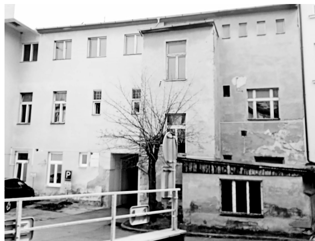
Zejména zadní část budovy polikliniky je opravdu v žalostném stavu.