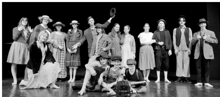
Letošním absolventským představením literárně-dramatického oboru ZUŠ se stal netradičně muzikál. Náš Tom je autorskou inscenací studentů a jejich pedagogů na motivy knihy amerického spisovatele Marka Twaina Dobrodružství Toma Sawyera.