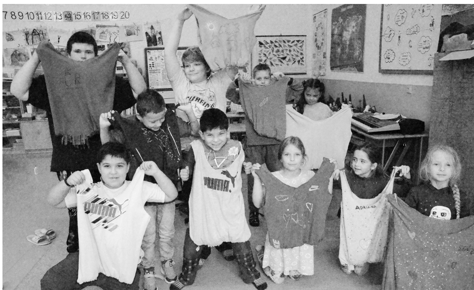
Výroba tašky ze starého trička

Za všechny splněné úkoly dostaneme body a za body dobré umístění, které nám loni přineslo poukázku na nákup v Kauflandu. Koupili jsme si truhlíky, semínka a další potřeby na zahradničení. Už nám