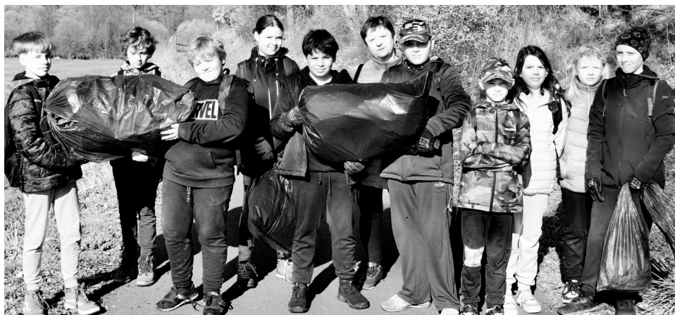
Žáci jesenícké školy se 4. dubna zapojili do akce Uklidme Česko. Více na str. 5

Nyní jsem v Nechvalicích šestým rokem a jestli se změnila, tak to určitě není jen mojí zásluhou. Pokračování na straně 6