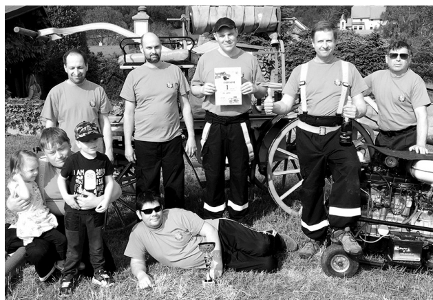
Domácí dobrovolní hasiči, vítězové soutěže k stoletému výročí SDH Lovčice v kategorii nad 35 let