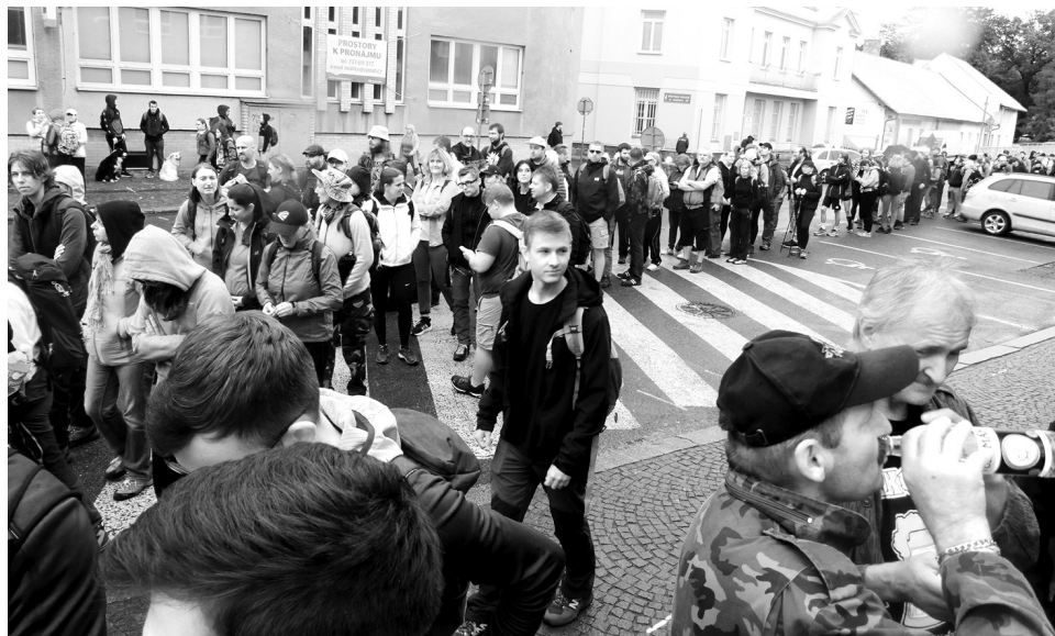
Zájem turistů o Robinovu trasu byl jako každoročně mimořádný.

dvojice turistů. Na startu měli oba Pražáci dobrou náladu, a jeden z nich nám dokonce prozradil jednu matematickou úva-