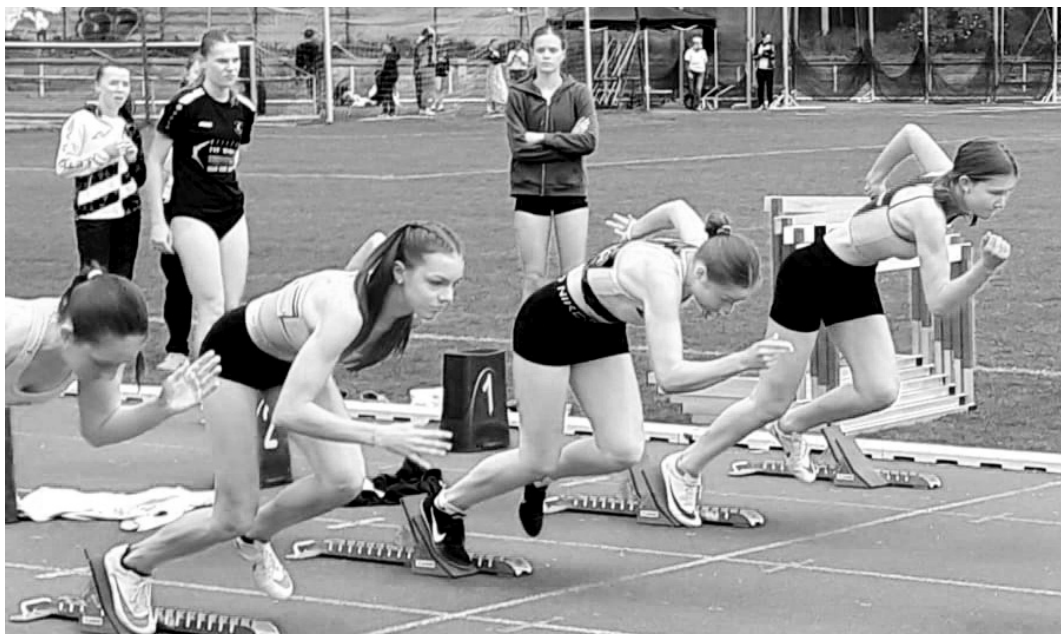
Z Krajského přeboru ve Vlašimi sice starší žáci žádný kov nepřivezli, nicméně důvod k radosti také měli. Snad každý z šestice si splnil nějaký svůj osobní rekord.