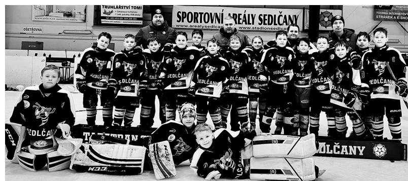
Hokejisté Tatrana ročníků 2014 a 2015

„V sezóně 2023/2024 jsme absolvovali dva turnaje, vánoční turnaj