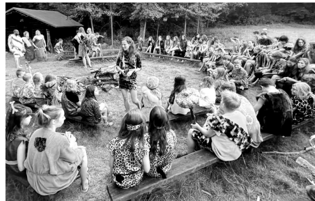
Tábor spolku Taksmetu se koná každý rok v jiném stylu. Loni se jeho účastníci ocitli v pravěku.

na je kosohorská, druhá benešovská a několik dětí je i z Prahy. Čtyři nebo pět vedoucích jezdí na tá-