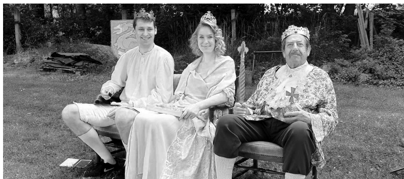
První stanoviště reprezentovala královská rodina.

● Koupím les, pole nebo chalupu. Platím hotově. Tel.: 773 770 753. 81/24