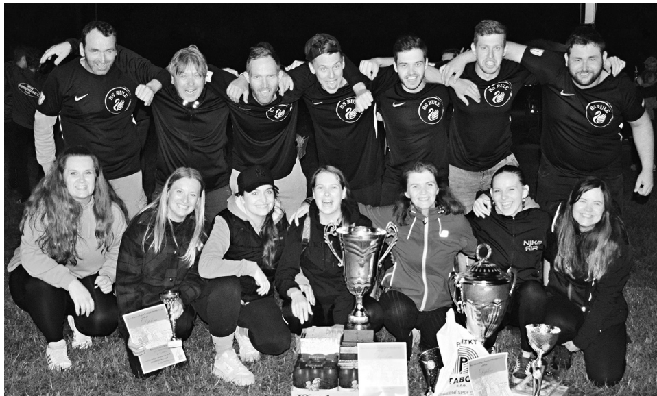
Vítězové soutěže – muži z SDH Mokřice a ženy z SDH Nedrahovice