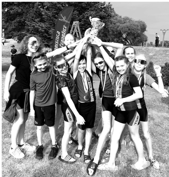
Mladí kanoisté při oslavách s pohárem