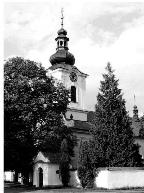
Na kostele svatého Petra a Pavla jsou hodiny od roku 1924.