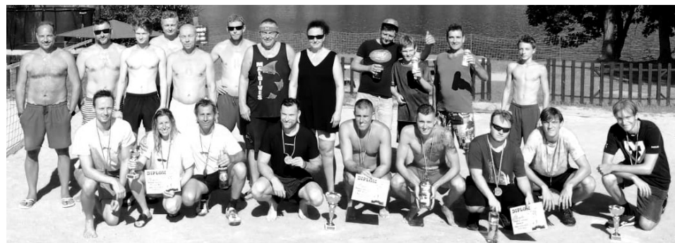
Účastníci nohejbalového turnaje na Oboze