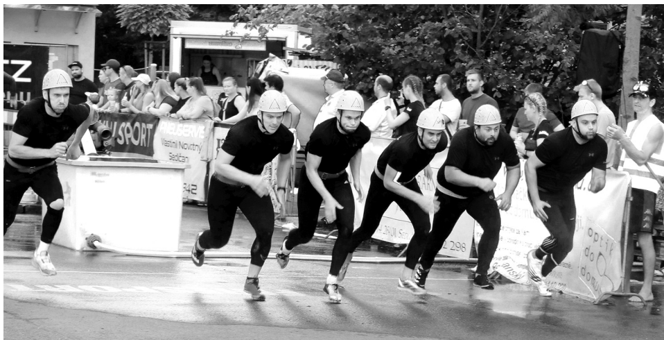
SDH Sedlčany na startu čtvrtfinále, v němž vyřadil Křížkový Újezdec.

nácté a dvanácté kolo Brdské ligy v požárním útoku dobrovolných hasičských sborů. Premiérově se soutěže zúčastnil SDH Sedlčany, který jinak startuje v celostátní extralize.