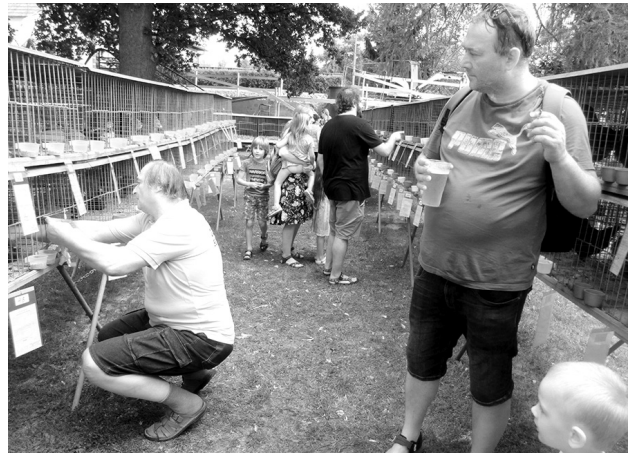
Areál Pod duby je při Povltavské výstavě každoročně zaplněn zájemci o chov drobného zvířectva.