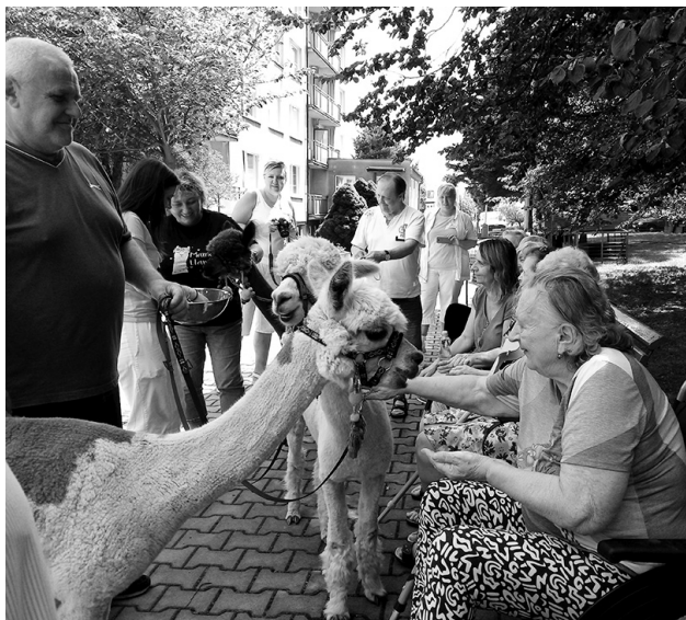
Klienti Domova měli možnost poznat, že lamy alpaka jsou velmi přátelské. Více na str. 4