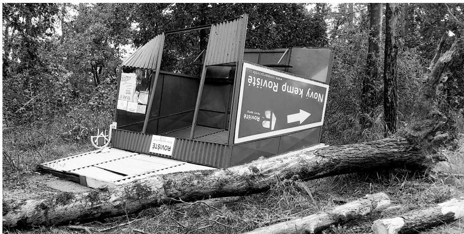
Na zastávku Roviště padl v pátek v noci strom.