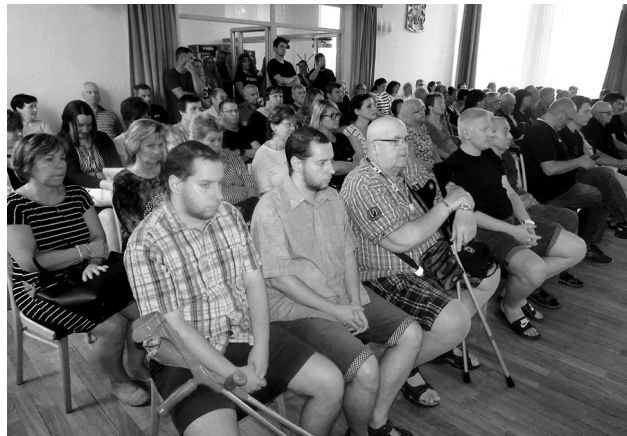
Společenský sál kulturního domu byl při posledním jednání zastupitelstva zaplněn jako už dlouho ne.