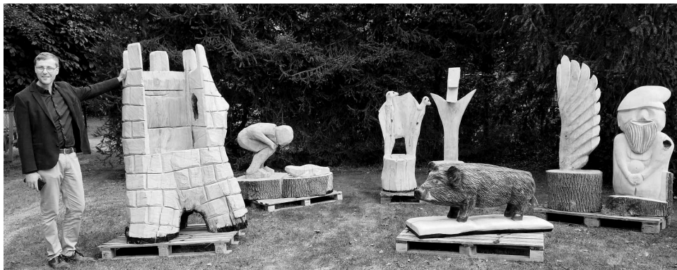
Petrovický starosta Pavel Kubíček před pondělním zasedáním zastupitelstva představil dřevěné sochy, které se brzy přesunou na své nové místo.

PETROVICE Před zasedáním zastupitelstva 9. září, rozhodla veřejnost společně se zastupiteli o umístění dřevěných soch z řezbářství, které se uskutečnilo v červenci v Petrovicích.