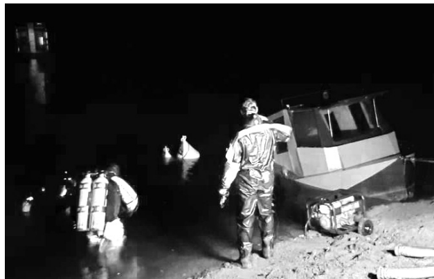
Profesionální zásah zachránil majiteli rybářskou loď, která se nedopatřením potopila.

ORLÍK V noci ze středy na čtvrtek 12. září potápěči Hasičské záchranné služby Jihočeského kraje pomohli na Orlíku vyzvednout potopenou rybářskou loď. Na místě zasahovala také jednotka dobrovolných hasičů. Jana Motřincová