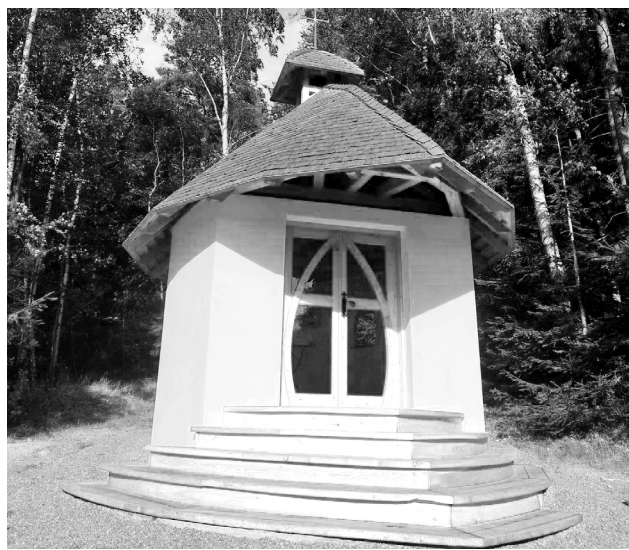
Kaple svaté Heleny