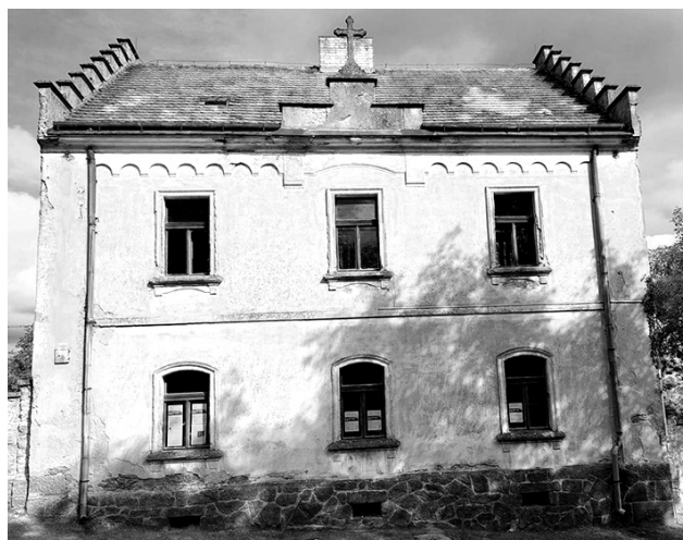
Fara v Obděnicích se stala kulturním místem. Pořádají se zde promítání, tvoření, diskuze a další.