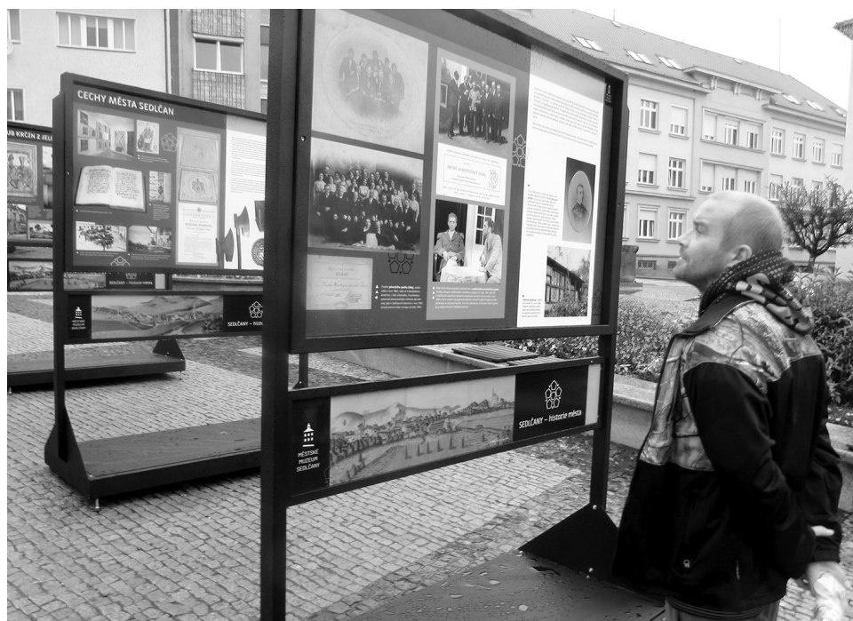
V těchto dnech si obyvatelé města i jeho návštěvníci mohou prohlížet venkovní výstavu, mapující historii Sedlčan.