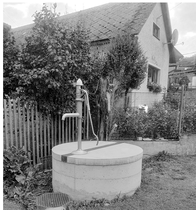
Studna v Mokřici prošla rekonstrukcí v druhé polovině září.

oprava kapličky a okolí v Podmokách a doplnění dětského hřiště Podmoky.