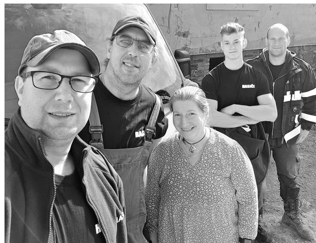
Dobrovolní hasiči z Křepenic pomáhali na Moravě po povodních.