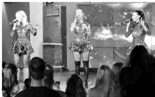
Holki roztančily Pohodu v Sedlčanech.