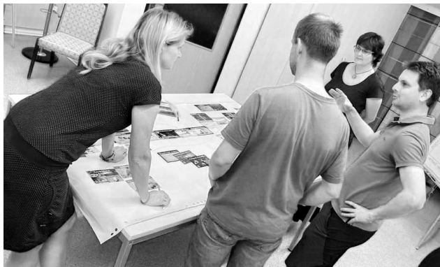
Momentka z červnového workshopu Klimatická mozaika v městské knihovně

vislostí, a společně přemýšlení a diskuze, nepůsobí tak odtaziť a složitě v porovnání s přednáškou typu frontální